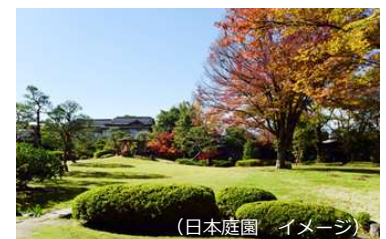
(日本庭園 イメージ)