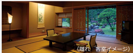
(離れ 客室イメージ)

富士山と中庭を望む純和風造りのお部屋。広々とした12.5畳の本間と4.5畳の次の間が快適な滞在を演出します。