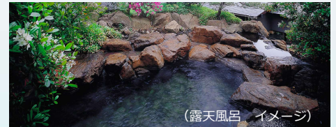
(露天風呂 イメージ)

開放的な窓と広くゆったりとした湯船、壁と天井は木材を使用し重厚で味のある男性大浴場。露天風呂は庭園の中にあり、四季折々の景色を眺めながらゆったりとお寛ぎいただけます。女性大浴場は縁で囲まれ、大きな窓からは採光が豊かに降り注ぎます。露天風呂は木の香り豊かな檜風呂。身も心もつるつるに、心癒され元気になる時間をお過ごし下さい。