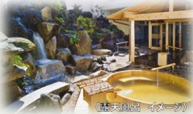
(露天風呂 イメージ)

【磯部温泉】 磯部温泉は、群馬県の南西部に位置し、近くを五街道の一つ、中山道が通っていることもあって、碓氷峠を往来する旅人や、近在からの湯治客で古くから賑わってまいりました。明治になってからは、信越線の開通により都会からの避暑のお客が多く見えられ、一層の賑わいをみせるようになりました。温泉マーク ® 発祥の地としても知られています。